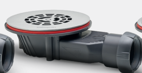
Grille plate inox brossé