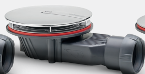
Dôme métal brossé zinc nickel