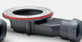
Sans grille pour receveur